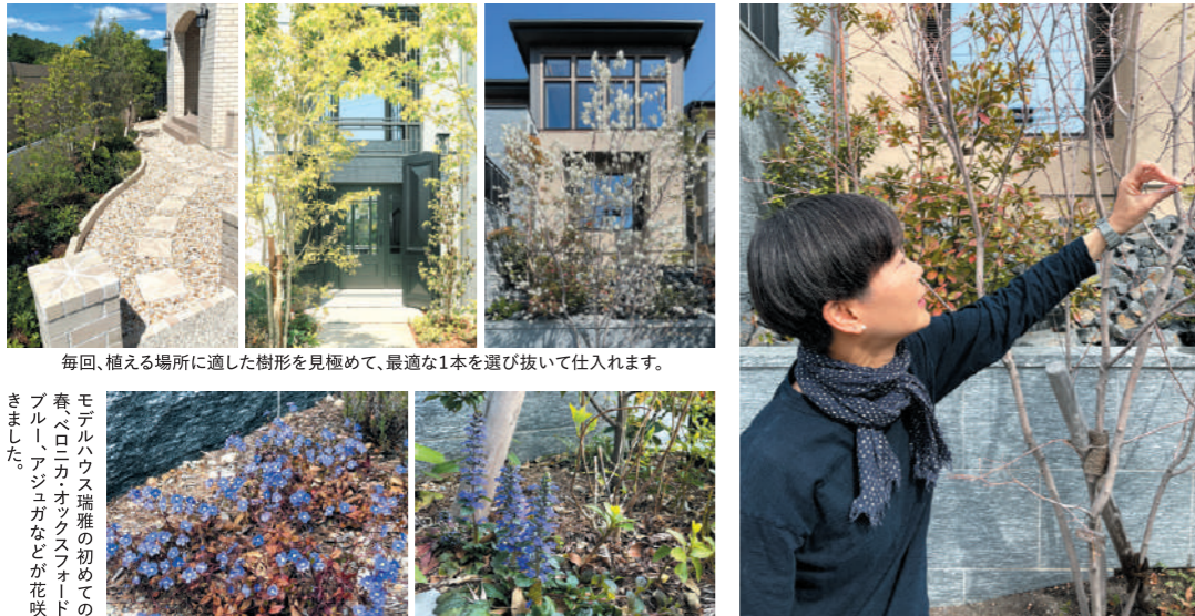
毎回、植える場所に適した樹形を見極めて、最適な1本を選び抜いて仕入れます。

モデルハウス瑞雅の初めての春ベロニカオックスフォードブルー、アジガなどが花咲きました。