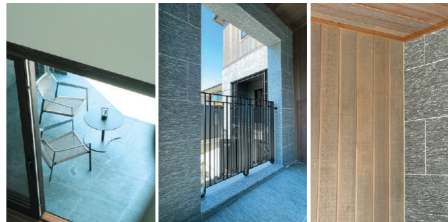
木製建具、ウエスタンレッドシダーの板張り、御影石。 質感も表情も異なる素材を組み合わせることで、奥行きと豊かさを感じさせる空間が生まれます。