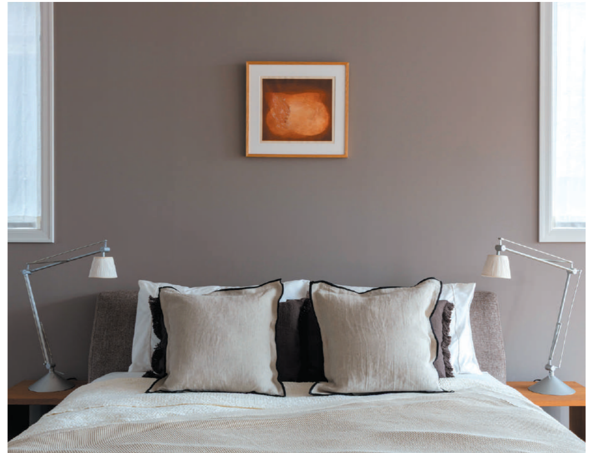
作家/吉田佳代子 タイトル/ははこ 2023-1 制作年/2023年 素材/和紙、銅版、木版、コラージュ、額装

線をつむぐ、形をつむぐ、空間をつむぐような感覚で版づくり、言葉、物語、想い、絆など 目に見えないものを繋ぎ合わせて「母と子」を表現しています。