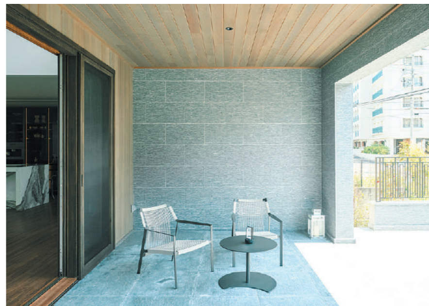
外部でありながら天候に左右されにくい設計です。