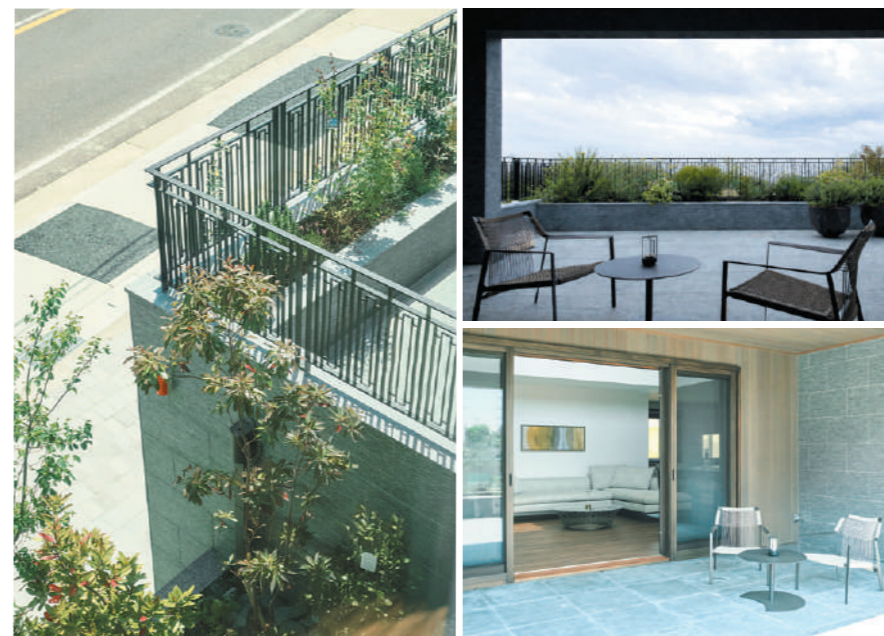
リビングのソファからも楽しめるように正面に設えた花壇が、四季の移ろいを日々の中にもやわらかく取り込みます。 ベルギーのアウトドア家具メーカーTRIBU (トリビュ) のラウンジチェアとサイドテーブル