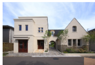
大府展示場 「Belle H.」